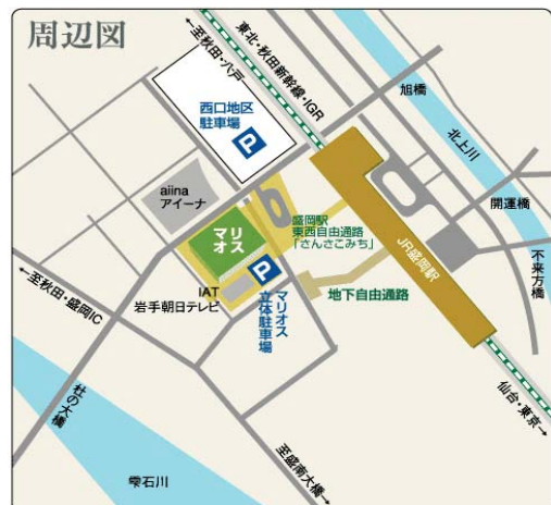
マリオス所在地/盛岡市盛岡駅西通二丁目9番1号

マリオス 18階 183~187 盛岡市盛岡駅西通二丁目9番地1号 ■盛岡駅から徒歩3分