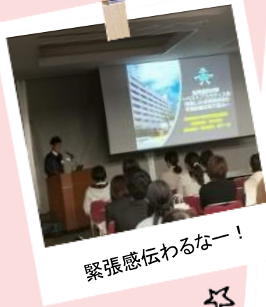
緊張感伝わるなー！